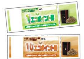
ペレット購入か間伐体験に参加するとエコポイントが!!

エコポイントを利用して、ペレットや地域の農作物、また環境にやさしい商品等と交換できます。