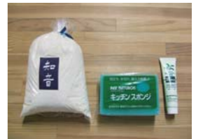
粉せっけん(左)(商品NO.306) キッチンスポンジ(中央)(商品NO.307) 歯磨き粉(右)(商品NO.308)