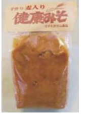
麦入り健康みそ(商品NO.207)