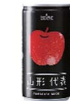
ジュース「山形代表リンゴ」 (商品NO.208)