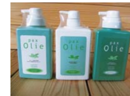
シャンプー(左)(商品NO.301) リンス(中央)(商品NO.302) ボディークリーム(右)(商品NO.303)