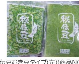
秘伝豆むき豆タイプ(左)(商品NO.205) 秘伝豆クラッシュタイプ(右)(商品NO.206)