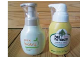
ベビー全身ソープ(左)(商品NO.304) ハンドソープ(右)(商品NO.305)