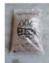
全木ペレット(商品NO.101)