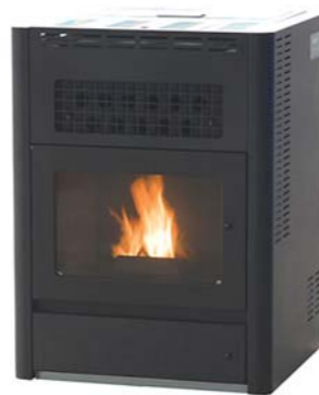
ペレットストーブ

ペレットストーブは、国内外の様々な製品があります。ペレットストーブでは、ペレットを1日約7時間でおおよそ10kg使用します。価格は、30~50万円程度（別途工事費）かかり、少し高価かもしれませんが、平成23年度は、市町村によってはペレットストーブの設置費用の1/3~1/2の補助金を出しているところもあり、通常の維持管理を行えば10年以上使用することができます。