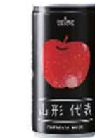
ジュース「山形代表リンゴ」(商品NO.208)