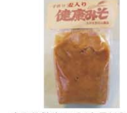
秘伝豆クラッシュタイプ(右)(商品NO.206)