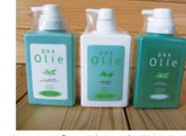
ボディークリーム(右)(商品NO.303)