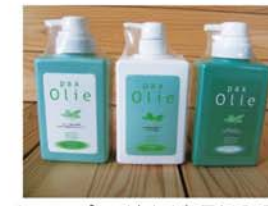
シャンプー(左)(商品NO.301)