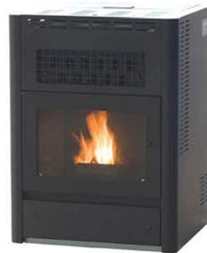
ペレットストーブ ㈱山本製作所HPより

ペレットストーブは、国内外の様々な製品があります。ペレットストーブでは、ペレットを1日約7時間でおおよそ10kg使用します。価格は、30~50万円程度（別途工事費）かかり、少し高価かもしれませんが、平成23年度は、市町村によってはペレットストーブの設置費用の1/3~1/2の補助金を出しているところもあり、通常の維持管理を行えば10年以上使用することができます。