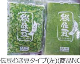
秘伝豆むき豆タイプ(左)(商品NO.205)