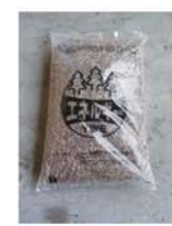
全木ペレット(商品NO.101)