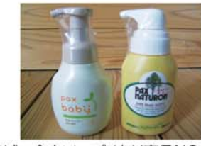
ハンドソープ(右)(商品NO.305)