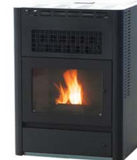
ペレットストーブ 【価格は30~50万円程度（工事費等は別途）】