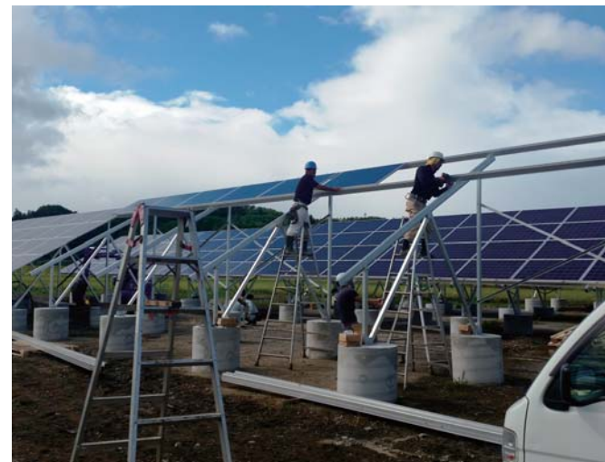
太陽光設備用の架台組立と太陽光パネルの設置工事