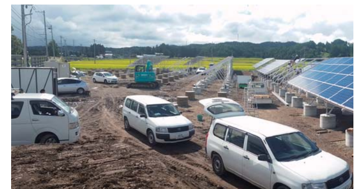
川西太陽光発電設備工事 全体風景