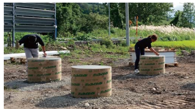
太陽光発電設備の架台 基礎工事の風景