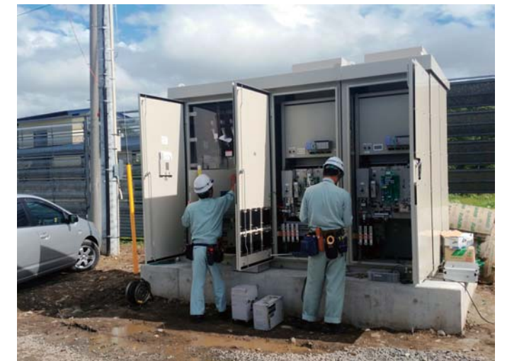
パワーコンディショナー&キュービクルの設備点検